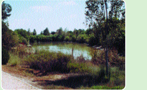
Λίμνη Αγίου Γεωργίου