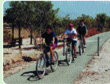
Ποδηλατόδρομος - πεζόδρομος

Για τη διακίνηση του κοινού εντός του πάρκου έχουν κατασκευαστεί 6 χιλιόμετρα ασφαλτόδρομοι, 16 χιλιόμετρα ποδηλατόδρομοι και 18 χιλιόμετρα πεζόδρομοι. Επίσης υπάρχουν αρκετά χιλιόμετρα διαχειριστικών δρόμων.